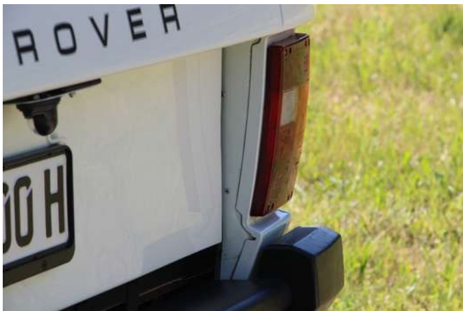
Defender“ aus unserer Kundschaft